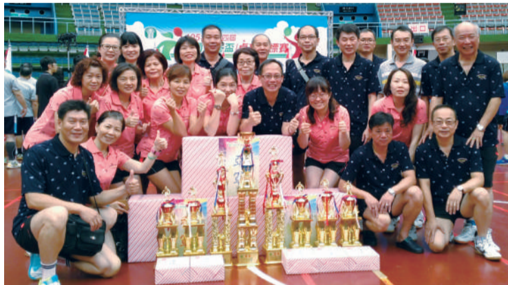
▲全體隊員發揮團隊精神，榮獲多項佳績。