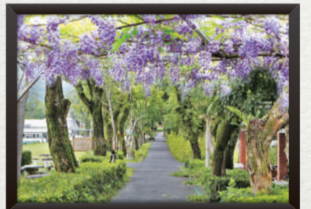
張長勝 — 紫藤大道