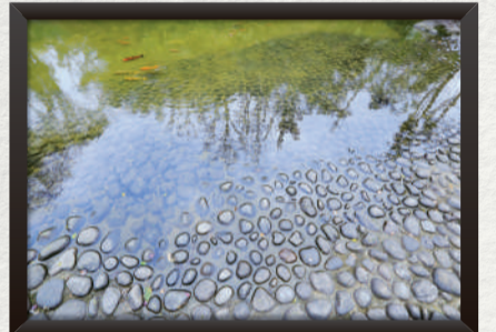
李鎮國 — 池塘雅趣