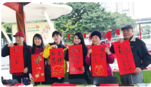
▲獲得手繪春聯的日本情侶(中)，感到十分高興。

為服務大臺北地區需要採買年貨的民眾，今年希望廣場年貨大街安排在1月26-27日、2月1-3日，一連兩週共計5天，讓消費者能彈性安排採購時間。