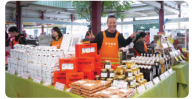
希望廣場 3 月份農特產品展售活動表