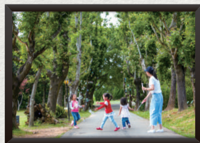
蕭華英 — 歡樂童年