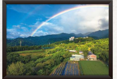
陳紫晴 — 遇見彩雙彩虹