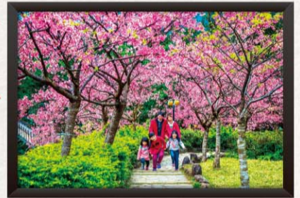
利勝章 — 歡樂遊