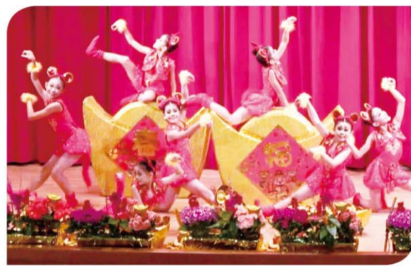
▲ 舞蹈競賽四健組冠軍—樹林區農會。

大會除了表彰各項農業獎項，同時辦理推廣成果競賽，由家政班員及四健會員展現平常所學成果；或者舞姿翩翩、優雅動人，或者青春活潑、熱力四射，精彩的表現讓大家讚嘆不已。感謝各界長官、參賽單位的蒞臨讓大會更加熱鬧、精彩，也祝福大家在新的一年好運、鈔票「鼠」不完！（撰文／推廣部 盧怡琦）