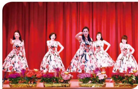
▲ 舞蹈競賽家政組冠軍—汐止區農會。