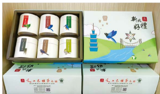
109 年「新北好茶」比賽茶上市預報

止（一年採 3 ~ 4 次），本季春茶由於孕育期長加上採製時較低溫，製成茶品除帶百花奔放活潑氣息，更添加冬茶之冷凝風味，絕對是春茶少遇的，值得推薦給大家鑑賞不一樣的凝香春茶！（撰文／文山茶推廣中心 賴水成）