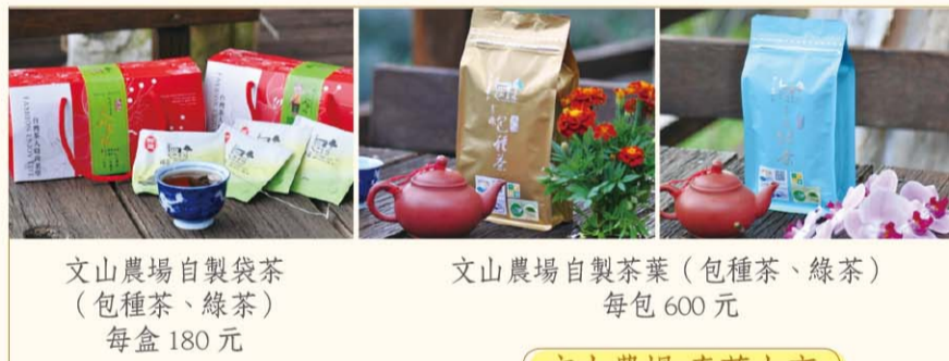
文山農場自製袋茶 (包種茶、綠茶) 每盒 180 元

文山農場自民國 86 年起轉型為有機茶園，不使用任何化學農藥與肥料，努力維護農場自然生態環境，在民國 100 年時，農場的環境受到螢火蟲的認可，開始在場內發現野生螢火蟲族群，同時農場也請教許多專家學者，致力於螢火蟲棲地的營造。螢火蟲復育至今已有 5、6 年了，獲得莫大的成功，更取得慈心綠色