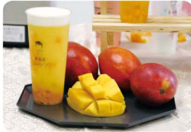
▲當季的國產芒果淋佐芝士奶蓋，色澤繽紛、香氣四溢。