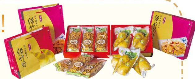
新北市五股區農會特產伴手禮

藉著天然環境的優勢及農友後天的努力，每每提到五股就會使人想到美味的觀音山綠竹筍，這也是我們最驕傲的特產，歡迎大家把握產季盡情訂購！(撰文/五股農會 林美惠)