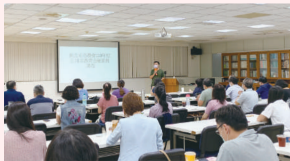
從業人員之專業知能及提升服務品質。（撰文／輔導部 李佳儒）

為使信用部員工有多元進修管道，本會已連續多年與農業金庫合作辦理，皆獲得高度迴響！本次邀請的講師對農會金融業務相當熟悉，學員們踴躍參與並提問，顯見對此課程議題的關心，一整天的課程收穫滿滿，相信更加充實各農會伙伴對法令的認識，強化農業金融