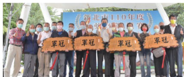
▲ 長官貴賓與冠軍得獎者合影。

山藥有著「男人的補品 女人的保養品」的美名，吃山藥的益處多多，更能與各種食材相輔相成，並名列新北三寶之一。