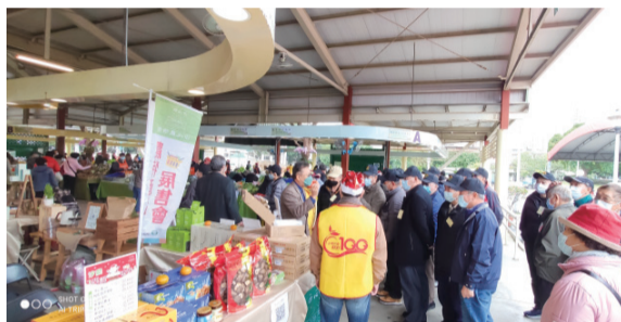
▲ 希望廣場假日採購人潮踴躍，早已成為臺北市民的食材採買首選。