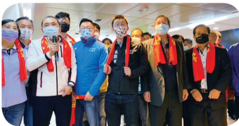
▲ 侯友宜市長(左3)前往市立聯合醫院三重院區關心農漁民健檢情形，本會林讚枝理事長(右2)、林文良常務監事(右1)亦特地到場關心長者。

凡設籍新北市、年滿50歲以上且具有農漁會會員或農保資格者，每2年即可向戶籍所在地的農漁會報名參加免費的健康檢查；而明年起，具原住民身分且年滿40歲的農漁友，也可享每2年1次的免費健檢喔！(撰文/推廣部 陳惠珊)