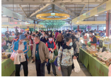
▲台北希望廣場週年慶場內熱鬧滾滾。

定攤位享好禮優惠、椪柑買四斤送一斤、產銷履歷豬排買二送一優惠活動。此外，在嘉義縣農會展售攤位消費滿1,000元，即送優惠住宿券乙張。當日消費滿500元，即