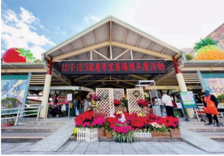
▲台北希望廣場週年慶，於110年12月4日至5日舉辦各式活動。