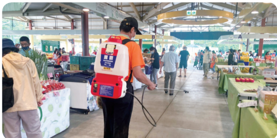
▲ 展售期間安排專人定時進行環境消毒。

自從新冠疫情爆發以來，對所有人的生活型態與工作模式帶來很大的改變，有關落實個人及場所防疫管理已經成為各場所是否能正常營運的重要課題。