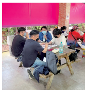
▲ 小組一同認真學習。