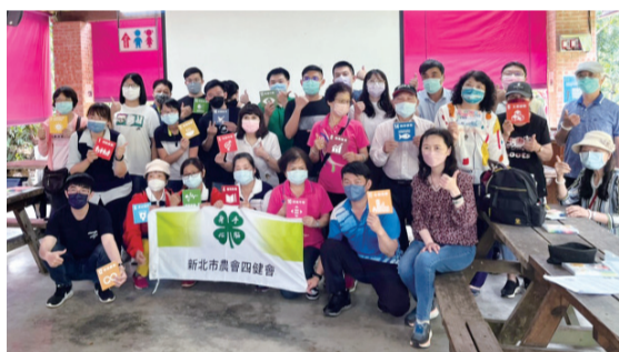
▲ 研習活動大成功，大家滿載而歸。