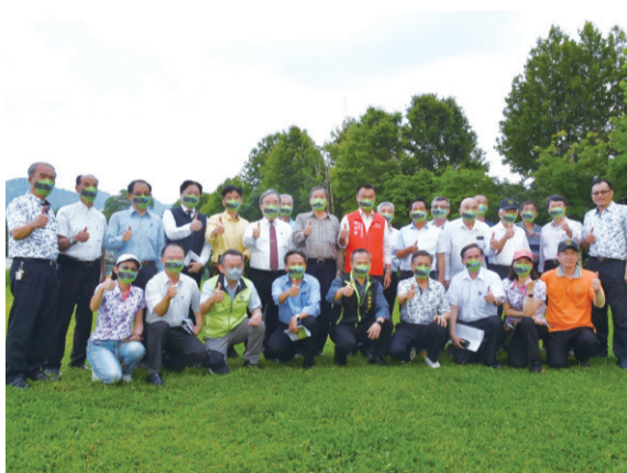
▲農委會長官與本會理監事及同仁共同合照，相約日後再聚文山農場。

陳主委表示將請農委會各局處首長就今天陳述的議題共同研究解決，以實際的行動來照顧農民。會後大家進行合照，並相約日後再聚文山農場，一起欣賞農場四季美景！（撰文／會務部 周泰平）