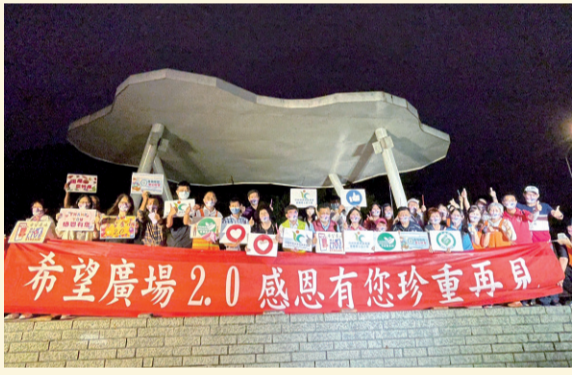
▲農糧署陳啟樂主任秘書與農糧署各與會單位長官，以及希望廣場農民代表、志工代表等貴賓共同於 2.0 舞台合照留念。

希望廣場於 10 月 8 日舉辦感恩系列活動，邀請長久以來支持希望廣場的好朋友、農友及無私提供協助的志工們，一同來參與希望廣場 2.0 最後一週的展售。 現場邀請到「半休耕小農那卡西樂團」，樂團是由蘇玉燕等多位農友共同成立，優美的歌聲驚艷全場，甚至被喻為「被農業耽誤的歌手」。感恩會尾聲邀請來賓一同合唱「感恩的心」，代表對 2.0 無盡的感謝與懷念；希望廣場不但是農友展售農產品的場域，也是全臺灣農友互相交流，傳遞農產品知識給