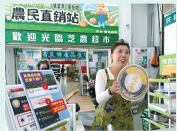
▲新北三芝區農會超市農民直銷站推廣農特產品：結合三芝茭白筍、梯田米料理的「茭白筍飯」。