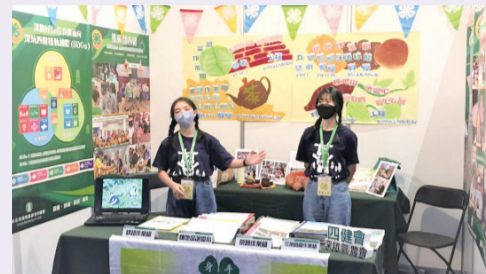
▲深坑區農會深農好食在作業組

狂賀！本市10月29日於國立中興大學附屬臺中高級農業職業學校，參加由中華民國四健協會舉辦之全國四健作業組比賽獲得佳績，深坑區農會深農好食在作業組榮獲中高級A組三等獎，汐止區農會水稻田作業組榮獲幼初級A組優等。（撰文／推廣部 馬瑀婷）