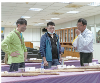
▲評審委員仔細評鑑。