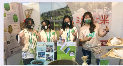
▲汐止區農會水稻田作業組