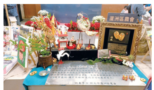
▲ 蘆農透過神將文化和秀英花系列推動食農教育與綠色照顧。