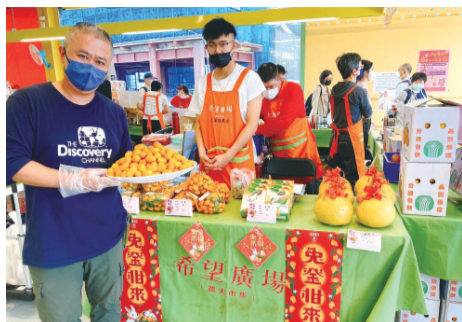
▲宜蘭最具有代表性的水果—免金柑來(金柑)，歡迎大家一同品嚐。