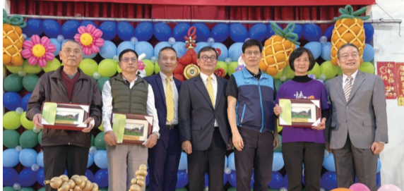
鶯歌區農會慶祝112年農民節大會 鶯歌農會

新北市各農會陸續舉辦農民節慶祝大會，表揚農業產銷有功人員、優良農民及有功人員等，感謝他們對農業的努力與付出，並表彰優良推廣人員對農會業務的協助，使得各項業務順利推動，各農會除了表揚頒獎還穿插許多表演活動，增添熱鬧慶祝的氣氛。（撰文／推廣部 陳惠珊）