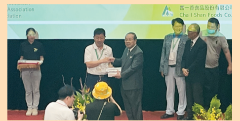
▲ 韓國四健協會（左）向中華民國四健協會（右）致贈紀念品。

四健會已創立120多年，期間成功培育了許多優秀的農村青少年，各行各業皆有四健人的身影，期許四健會能生生不息，繼續替國家、社會培育優秀的青年！（撰文／推廣部 馬瑀婷）