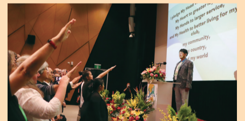
▲ 四健夥伴們一同宣示四健公約。