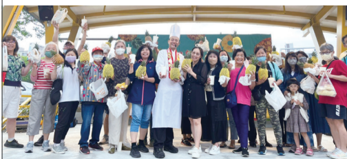
▲ 鳳梨推推推活動圓滿成功。

配合行政院農業委員會「食農教育—鳳梨推推推」政策，本會5月13日於希望廣場舉辦「享當令，食在地」的鳳梨DIY活動，現場開放60名消費者參加，氣氛熱烈，吸引民眾駐足觀看，共襄盛舉。