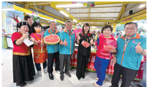
▲陳淑雯處長(右3)及游毓蘭立委(右2)等嘉賓推廣花蓮大西瓜，邀您體驗一年一度的夏季限定滋味。