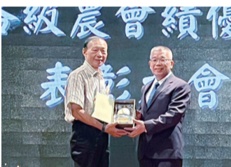
▲淡水區農會／高忠總幹事。