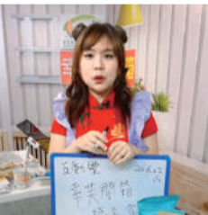
▲ 透過直播輕鬆聊播方式凝聚粉絲黏著度。