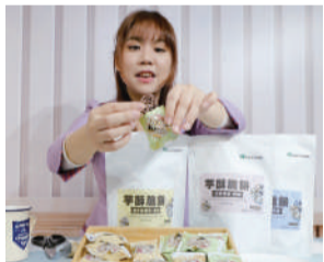
▲ 真情小編試吃口感並分享心得。