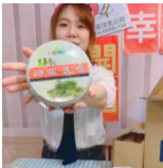
▲ 透過開箱傳遞真情銷售的商品及內容。

真情小編開箱囉！固定於每個禮拜三下午3點於Facebook開播，秉持著「幸福就在日常生活中」的心情，與線上粉絲們輕鬆互動聊播，每檔次的開箱直播結合季節特色及行銷活動來訂定節目主題，教大家如何採購最划算，也透過直播讓大家更清楚本檔次的行銷活動，藉由直播拍攝短影音，跟著現代多媒體趨勢社群的推廣，使消費者瀏覽商品以外，還能夠有視、聽覺效果，讓真情品牌記憶立體化深植人心。