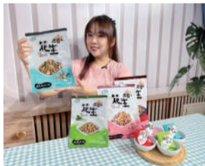
▲ 開箱各區域農會零嘴商品。

真情食品館網路商城，是國內首屈一指的農特產品線上購物網站，自1999年12月22日成立至今已有24餘年，始終是臺灣地區農特產品B2C電子商務網站的標竿。跟隨著時代的流行趨勢，真情也導入了受眾群喜愛的日常開箱，採用小編親近的身分，站在消費者的角度分享美食試吃心得及乾貨商品等開箱，用最簡單的方式透過直播與粉絲互動，凝聚粉絲的黏著度及傳遞真情銷售的農特產品內容。