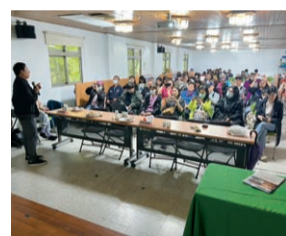
▲基層農事夥伴+家政班員共同合上 Canva 軟體照片編修課程。