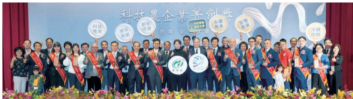
▲ 第九屆科技農企業菁創獎頒獎典禮熱鬧非凡，鼓勵 8 家正式得獎業者及 6 家潛力業者。

第九屆科技農企業菁創獎頒獎典禮，於 3 月 20 日下午在農業部 5 樓大禮堂盛大舉行，由農業部范美玲主任秘書頒獎給 8 家得獎業者。本屆菁創獎分為「創新研發」與「科技應用」兩類，共計有 38 家業者報名，20 家進入複選實地審查，最後選出「科技應用類」4 家，由宏昇芽菜、展鮮農產生技、新北市農會、聯利農業科獲獎。「創新研發類」4 家則由臺灣糖業、生展生物科技、金翔生物科技、興農有限公司獲獎。本會也是農業界第一家得獎農會！