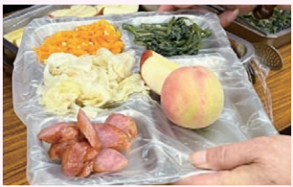
▲ 農友將醜蔬果捐贈出來延續食物價值。