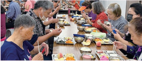
▲ 百位銀髮族共同用餐。