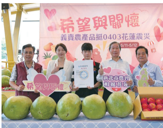
▲ 花蓮縣政府黃專員(中)代表花蓮縣政府頒發感謝狀。