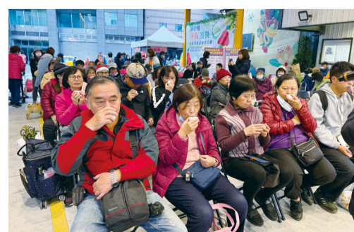
▲體驗品茗活動的朋友都對一斤價值5萬元特等獎好茶讚賞有加。