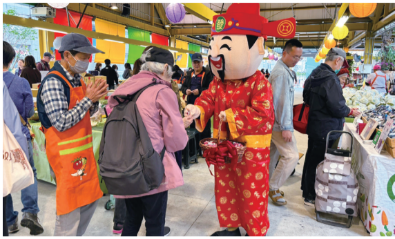
▲財神爺分送薑糖，祝福農民及現場朋友財運滾滾來！