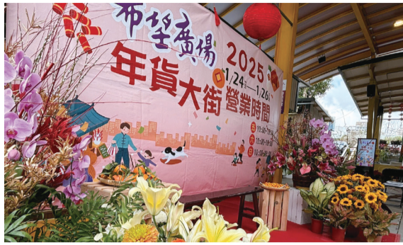
▲結合宜蘭當週主題「金銀滿蘭陽」與「花現希望」布置打卡地標！

希望廣場聽到好朋友們想購買年貨的心聲，因此特別在1月24～26日三天辦理「蛇年豐收年貨大街」，讓大家一站購足所需年貨。