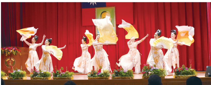
▲ 中和地區農會家政班精彩的舞蹈表演。

今年農民節活動熱鬧非凡，本次農民節除表彰對農業有功人員和單位之外，今年新增表揚資深選任人員，擴大表彰對農業盡心盡力之人；此外，今年度農民節另有舉辦之成果競賽亦是精彩絕倫，最後，家政組由中和地區農會奪冠。除了成果競賽之外，本次農民節邀請深坑區農會帶來手鼓樂舞，這支特殊的隊伍由一群平均年齡超過 75 歲的長者組成，最高齡者甚至達到 98 歲！他們的表演充滿活力，每一次的鼓聲都彷彿訴說著一段段豐富的人生故事。最後，活動尾聲在緊張刺激的摸彩活動中圓滿結束，感謝各位的參與，在新的一年里持續為新北農業努力奮鬥。（撰文／推廣部馬瑀婷）