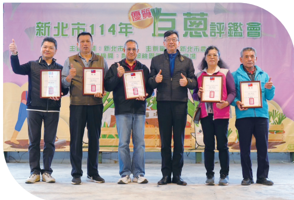
▲ 新北市政府副市長錫輝局長（右三）與鑽質級得主合影。

為了讓本市農產品更豐富多元，本會於1月18日在希望廣場舉辦農友期待的優質巨蔥評鑑會，這是北部地區首次辦理的巨蔥評鑑活動，現場熱鬧非凡，更是吸引眾多好奇的目光。此次出席的長官包括農業部科長吳杏如、農糧署北區分署副分署長黃怡仁、新北市政府農業局長錫錫輝、中華民國農會副理事長白添枝、本會三首長、理監事及各區農會三首長等。