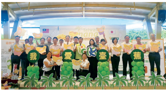
▲ 農糧署姚士源署長(中)與出席活動貴賓共同推廣國產香蕉。