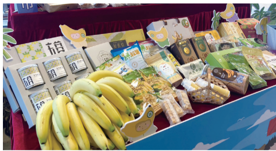
▲ 國產香蕉美味香甜，日本持續採購供應學校午餐。

臺灣香蕉香甜又Q彈，特別是在秋冬時節，生長環境早晚日夜溫差大，蕉株生長速度緩慢，果肉扎實且養分充足，是擄獲日本人味蕾、臺灣水果的最佳代言人。