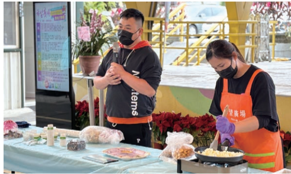
▲青農小學堂：好事會花生，現場製作雪Q餅，香氣十足！

中華民國農會於2月22日至23日在希望廣場辦理展售活動，精選了全台30位青年農民，帶來新氣象。此次活動不僅有5位首次參展的青年農民，新增了農業生力軍！此外，主辦單位舉辦了3場親子同樂的食農教育活動，讓家長可以帶小朋友認識農產品。