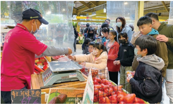
▲上課的小朋友從購買開始學習挑選番茄的訣竅。