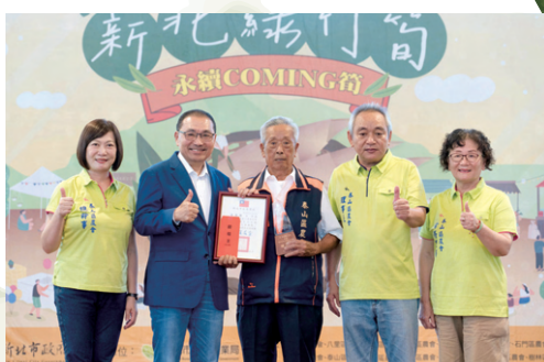
▲ 泰山唐德輔農友（中）榮獲甜筍王。