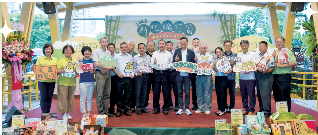
▲ 新北綠竹筍季系列活動正式開跑。