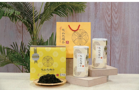
▲ 包種茶香氣清香幽雅，滋味甘醇滑潤，香氣越濃郁品質越高級。