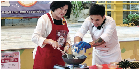
▲ 阿善師煮菜架式十足。

鰻魚也能這樣吃？雲林縣政府與農業部漁業署於 6 月 14 日在台北希望廣場農民市集舉辦「雲林鰻鰻饗宴」，現場香氣四溢，創意鰻魚料理大放異彩！從鰻魚三明治、野菇脆餅到魚卵握壽司，鰻魚新吃法每道都讓人驚呼！