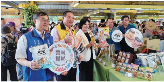
▲ 雲林縣長及長官來賓一同到展區為農友加油打氣。