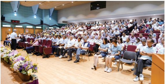
▲ 深入淺出的解說，理監事認真聆聽。