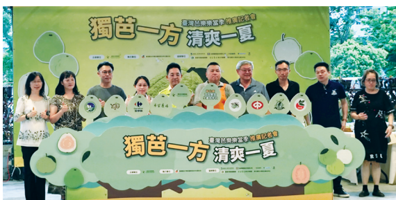
▲ 獨芭一方 清爽一夏，非常多長官來賓蒞臨支持。