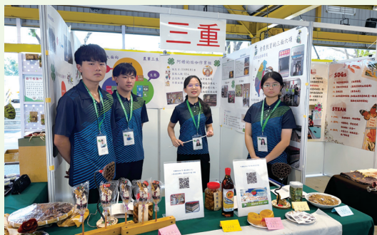
（撰文／推廣部 盧怡琦）