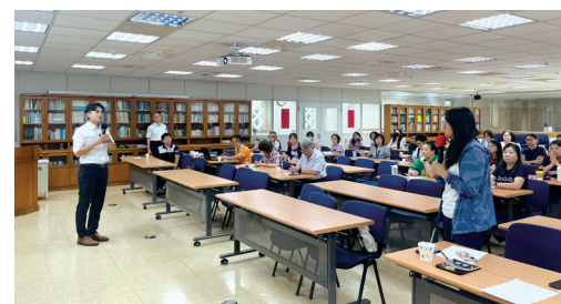
▲參與者踴躍提問，大家一起腦力激盪。

本次研習與會者皆表示收穫豐富，不僅釐清計畫執行的細節，也促進跨區經驗傳承與合作，為日後更有效率推動各項農業推廣計畫奠定良好基礎。（撰文／推廣部 馬瑀婷）