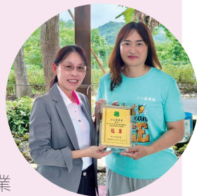
四健作業組教案設計競賽績優單位名單

為提升四健指導員教案設計能力，並提供未來四健工作人員實務參考，本會特別舉辦「114年度四健作業組教案競賽」，邀集轄內12家農會四健指導員參與。此次競賽不僅展現各指導員的創意與專業，也為即將到來的全國四健教案競賽打下堅實基礎。經過激烈角逐，競賽成績如下表，接著將由三芝、土城、汐止、新莊、蘆洲等5家農會代表新北市參加全國四健教案競賽，爭取更高榮譽。（撰文／推廣部 盧怡琦）