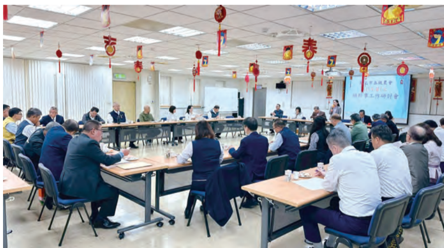
▲本市各農會總幹事踴躍出席本次研討會。