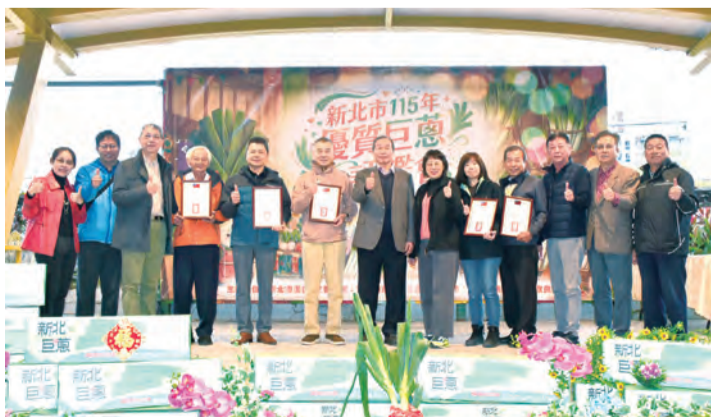
▲ 參與來賓與鑽質級農友合影。

新北市氣候溫和涼爽，相當適合巨蔥生長。透過本次優質巨蔥評鑑會，不僅展現各地農友的栽培成果，也證明新北具備發展大規模巨蔥栽種的潛力。期盼未來巨蔥能成為新北代表性農作物之一，穩定供應北部市場需求，進一步提升農民收益。（撰文／推廣部 周泰平）