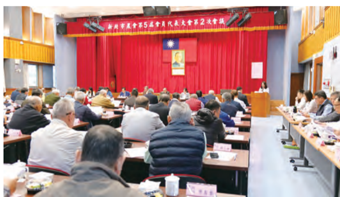
▲會議中本會幹部向各會員代表進行業務說明。

廣場創造 2.7 億元的營業額；文山農場得到「2025 淨零永續農業卓越獎」特優獎，是全國第一家獲獎的農會；超市直播易利購業務拓展至 200 個取貨點，並且達成 3,989 萬元的營業額，期望新的一年