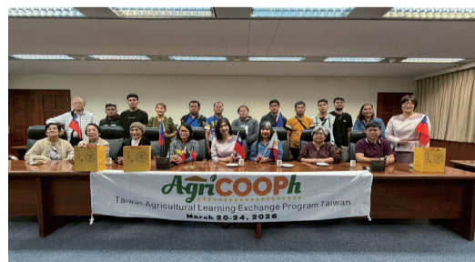
▲3月24日菲律賓家庭農民農漁林合作社聯盟 (The Philippine Family Farmers' Agriculture, Fisheries and Forestry Cooperatives Federation) 參訪本會。

此外，3月24日菲律賓家庭農民農漁林合作社聯盟 (The Philippine Family Farmers' Agriculture, Fisheries and Forestry Cooperatives Federation) 亦專程蒞臨本會進行交流參訪，進一步就農會組織運作、農業推廣及農產運銷等議題進行意見交換，持續深化國際農業合作關係。未來，本會將持續推動國際交流，讓在地農業走向國際，同時將永續與食農理念傳遞給更多人。(撰文／推廣部 馬瑀婷)