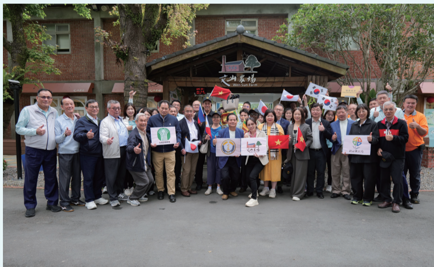
▲2026年度亞洲農民合作組織會議 (AFGC) 代表團參訪本會。