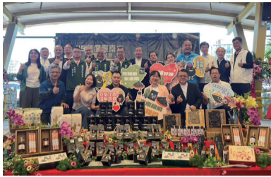
▲ 現場冠蓋雲集，大力推薦佳里區農會胡麻油。