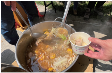
▲ 香氣撲鼻，熱騰騰的麻油雞。