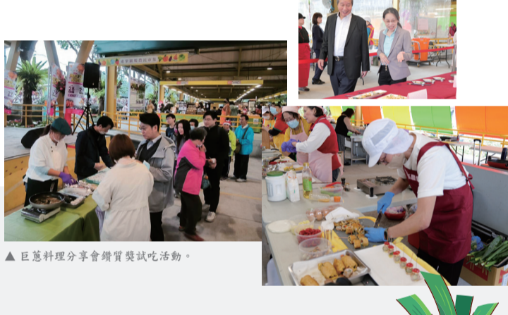
▲ 巨蔥料理分享會鑽質獎試吃活動。

為推廣本市特色農產「巨蔥」之多元應用，本會於3月26日在台北希望廣場辦理「新北市115年度家政推廣教育巨蔥料理分享會」，邀集本市24家農會家政班員共同參與，透過料理分享形式，展現家政班員的創意巧思與實作能力，本會理事長及總幹事亦親臨現場，共同關心活動辦理情形並為參賽人員加油打氣。