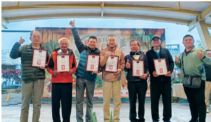
▲ 筆者（右 3）與蘆洲區農會會長官及其他人分享得獎喜悅。