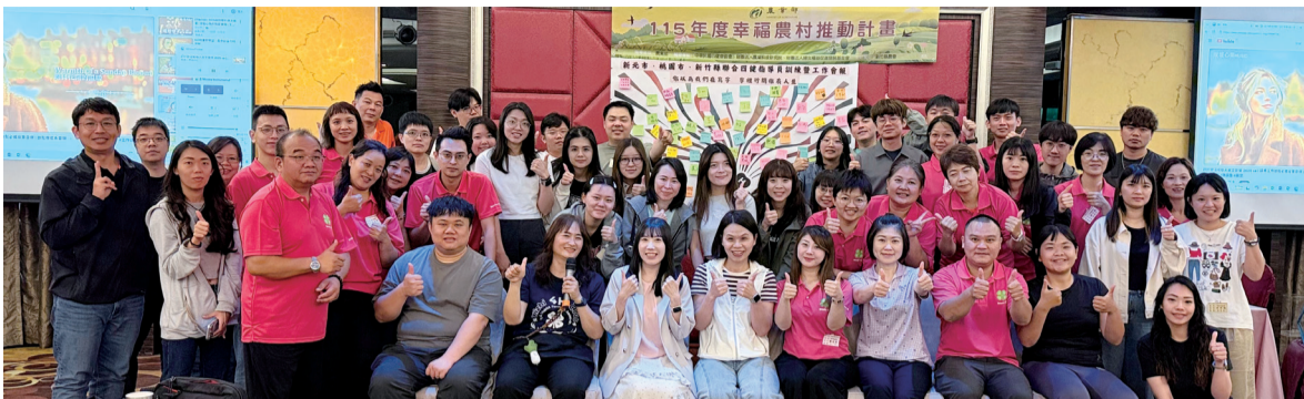
▲所有單位一起為這次聯合訓練留下美好記憶。

為強化四健指導員的專業知能，並促進縣市間的經驗交流，新北市、桃園市與新竹縣於4月23-24日，假苗栗鬱金香酒店盛大辦理「四健指導員聯合訓練」。本次活動打破以往單一縣市辦理的模式，首度採取「北區聯合」形式，吸引基層農會指導員熱烈參與，總計有49位夥伴共襄盛舉。