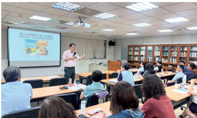
▲ 透過本次主管課程大幅強化各農會主管的領導影響力。

有因時、因地制宜是最好」，期盼透過本次培訓能大幅強化各農會主管的領導影響力，並激發同仁主動積極的服務意願，共同為農會打造具備高度凝聚力與永續發展的卓越團隊！（撰文／輔導部 邱寶全）